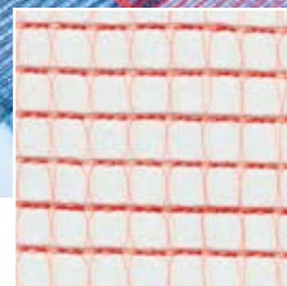
TRAMA A QUADRELLI