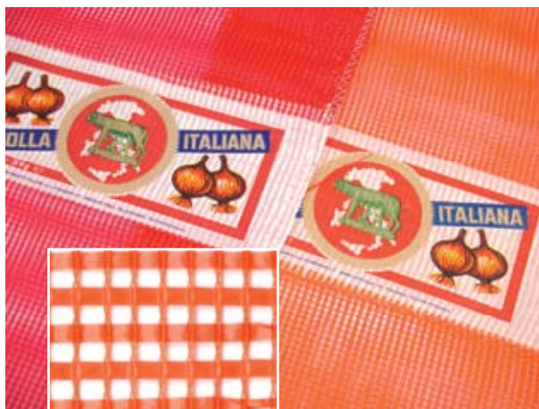
RETE DI PIATTINA