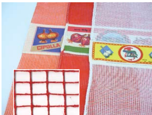
RETE DI COTONE

... qualità elevata e costante, esperienza e servizio accurato sono la chiave del nostro successo